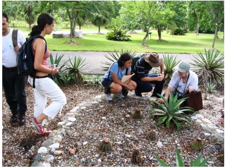
Algunos de los estudiantes y profesores participantes en el curso de cactáceas ofrecido por la SLCCS en la Universidad Autónoma y el Jardín Botánico de Santo Domingo, República Dominicana.

ción de una página Web de la Sociedad, la ampliación de la representación regional a un mayor número de países y a más de un representante, en el caso de países extensos como México y Brasil, el apoyo a la publicación de catálogos y floras locales o regionales de cactáceas y otras suculentas, y finalmente, la búsqueda de apoyo para el desarrollo de investigaciones sobre conservación y manejo de especies promisorias y bajo algún tipo de amenaza.