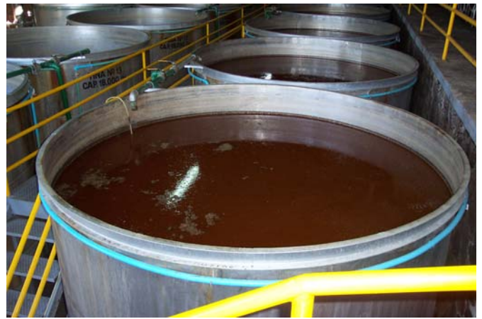
Tanques de fermentación para la elaboración del tequila, bebida alcohólica derivada de los magueyes.

De esta multiplicidad de usos han prevalecido algunos, transformándose a lo largo de la historia, y desarrollándose otros más, con lo que se han llegado a calcular hasta en 70 hoy en día. El más conocido de todos ellos es el de su aprovechamiento para la elaboración de bebidas alcohólicas, de las que las destiladas han ido ganando importancia tanto en el mercado nacional como el internacional.