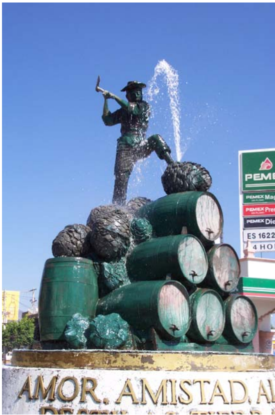
Estatua alusiva a la industria tequilera en el pueblo de Tequila, Jalisco, México.