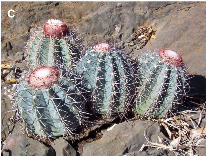
Colibrí visitando flores de M. paucispinus (A), lagarto consumiendo frutos de M. glaucescens (B) y grupo de M. azureus.