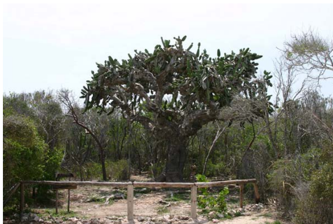
Relicto de las poblaciones de Dendrocereus nudiflorus en la Reserva Ecológica "Varhicacos", especie fuertemente afectada por el desarrollo turístico.

La meta del Programa de Conservación de Cactus Cubanos es propiciar la conservación y manejo de los cactus cubanos y sus hábitats por medio de (1) la capacitación de especialistas y técnicos para su estudio, conservación y manejo, (2) la realización de investigaciones que incrementen el conocimiento existente sobre las cactáceas cubanas y sus hábitats, (3) la evaluación del impacto de las actividades socioeconómicas de las comunidades humanas relacionadas con los cactus y sus hábitats, (4) la conservación de la diversidad genética de las especies en peligro crítico, (5) la educación, el asesoramiento y la divulgación de información relevante a los decisores, (6) promover actividades de reproducción ex situ que contribuyan a disminuir la colecta de individuos en poblaciones silvestres y, (7) potenciar el desarrollo de grupos locales que trabajen en el manejo y la conservación de cactus.