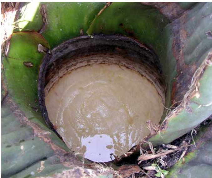
La cavidad ocupada originalmente por la gran inflorescencia en estado incipiente de desarrollo en una roseta de agave ahora almacena el 'aguamiel' para la fabricación del pulque.

El uso de los magueyes se remonta a la época precolombina, cuando los pueblos indígenas encontraron en esta maravillosa planta una fuente abastecedora de materia prima para elaborar decenas de productos. De las pencas obtenían hilos para tejer costales, tapetes, morrales, ceñidores, redes de pesca y cordeles; las pencas enteras se usaban para techar las casas a modo de tejado; los quiotes secos servían como combustible, vigas y cercas para delimitar terrenos; las púas o espinas se utilizaban como clavos y como agujas; de las raíces se elaboraban cepillos, escobas, escobetillas y canastas; del jugo del maguey, además del aguamiel, se obtenía la bebida ritual por excelencia: el pulque.