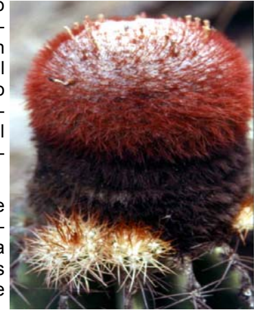
Melocactus hernandezii Fern. Alonso & Xhonneux.

En el marco del proyecto Conservación y Uso Sostenible de Biodiversidad en los Andes Colombianos, el Instituto Humboldt ha venido desarrollando investigaciones en temas relativos al uso de los recursos silvestres.