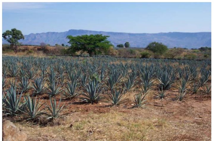
Siembra de agave azul ( Agave tequilana ) en Tequila, Jalisco, México.

Hasta la fecha se han descrito cerca de 200 especies de agave, en su gran mayoría por botánicos extranjeros. Sólo 10 especies han sido descubiertas y descritas por los botánicos connacionales, lo que realmente es de llamar la atención, si tomamos en cuenta que el 75% de las especies del mundo se distribuyen en México.