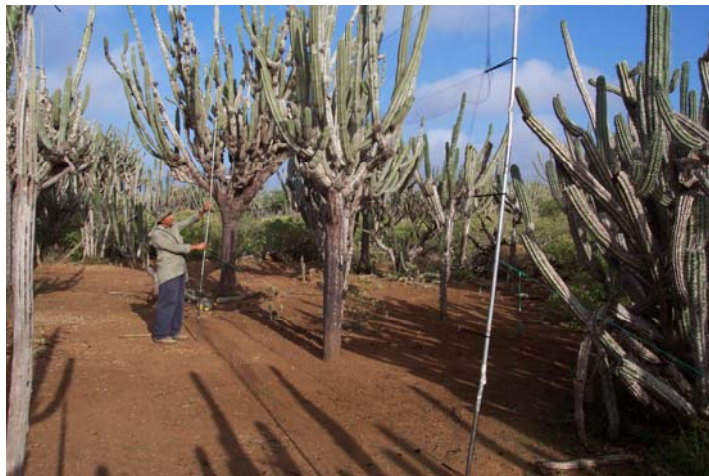
Sistema de captura de aves empleando mallas de neblina en un cardonal del Parque Nacional 'Cerro Saroche', Edo. Lara, Venezuela. (Foto: Jafet M. Nasar).

Estimar la importancia relativa de los cactus y agaves en la dieta de animales de zonas áridas va más allá de simplemente identificar y cuantificar renglones alimentarios en el contenido estomacal y fecal de las especies bajo estudio. Muchas especies animales dependen indirectamente de estas plantas, ya que se alimentan de especies que a su vez consumen tejidos derivados de los cactus y agaves. Una forma de acceder a esta información es a través del uso de la técnica de análisis de isótopos estables. Esta consiste en determinar la composición isotópica de elementos que conforman los tejidos de los organismos, y comparar dicha composición con la registrada en las posibles fuentes de alimento empleadas por los animales bajo estudio. La dieta de una especie en particular se refleja en la composición isotópica de los elementos que conforman sus tejidos. Se puede inferir así la importancia relativa de los distintos renglones alimenticios empleados por un organismo, siempre y cuando los mismos puedan discriminarse en base a su composición isotópica. Entre los elementos más comúnmente empleados en este tipo de análisis está el carbono ( ^{13}\text{C}/^{12}\text{C} ), que permite discriminar el mecanismo fotosintético de las plantas consumidas, y el nitrógeno ( ^{15}\text{N}/^{14}\text{N} ), que permite inferir el nivel trófico en el cual se encuentra un animal. Las plantas con metabolismo CAM (metabolismo ácido de las crasuláceas), presente en cactus y agaves, muestran una