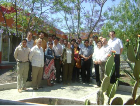
Taller Tecnologías Sustentable

El grupo de investigación ha participado en numerosos proyectos de investigación, financiados tanto por organismos internacionales públicos y privados, como nacionales (Comisión Nacional del Agua, Unión Europea, Total SA, CONACYT, etcétera).