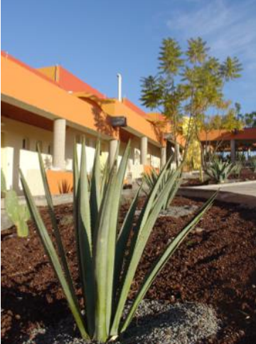
Instalaciones del LIPATA