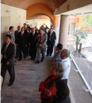
Inauguración del LIPATA por el Gobernador del Estado de Querétaro Lic. José Eduardo Calzada Rovirosa