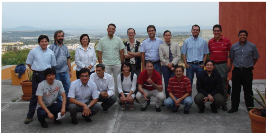
Proyecto Union Europea Fonciyt

Universidad Autónoma de Querétaro, Instituto Potosino de Investigación Científica y Tecnológica, Universidad de Guadalajara, Universidad Autónoma de San Luis Potosí, UAM-Iztapalapa, Universidad de Guanajuato, Instituto Nacional de Investigaciones Agronómicas (Francia ) Universidad Tecnológica de Compiègne (Francia) Politécnico de Milano- Italia, Universidad Católica de Lovaina (Bélgica) Universidad de California- Berkeley, Universidad Estatal de Arizona, Universidad de Purdue, Universidad Pontificia Católica de Valparaíso (Chile) Universidad de la Frontera (Chile) Universidad de Mons (Bélgica) Universidad de la República (Uruguay) Universidad de los Andes (Colombia)