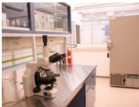
Laboratorio de Microbiología