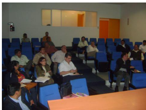
Auditorio del LIPATA