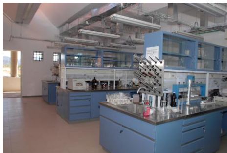
Laboratorio de Analítica